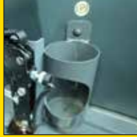
વોટર બોટલ હોલ્ડર