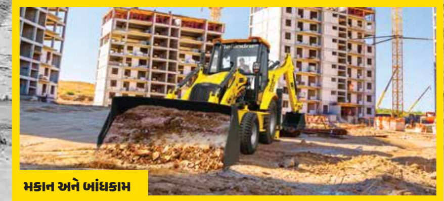
મકાન અને ખાંધકામ